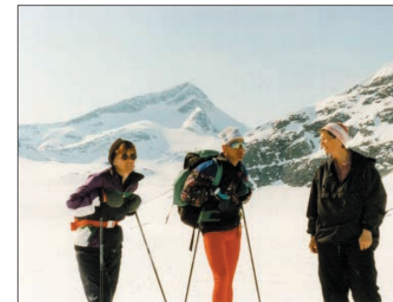
Neådalsssnota, Salen og Snota passerte vi tidligere på dagen.

begynner vi å treffe andre turgåere igjen. De dukker opp fra høyre og venstre. Med ryggsekk og liggeunderlag og hvite smil i solbrune fjes. Alle gir uttrykk for at dette har vært en av de riktig flotte turdager. Det er liv og røre ved de fleste av hyttene. Det er turfolket som har etablert seg med hytte i dette området. Og det finnes neppe mange områder som kan konkurrere med dette når det gjelder muligheter for skitur utover sen vinteren og våren. Her varer skiføret de fleste åra til godt ut i mai.