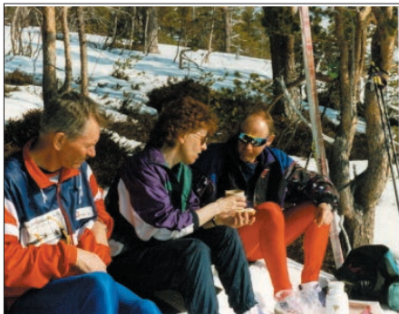
En fortjent godværsrast.

Fra starten på Kårvatn for vel 3 timer siden har vår tur steget litt over 600 m. Sola gjør snøen i hellinga langs nordbredden av Naustådalsvatnet vårblaut.