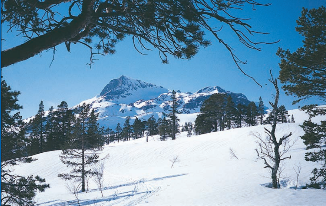
Snota i vinterdrakt.