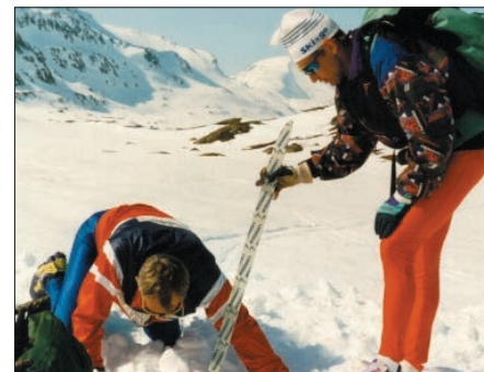
Den som leter finner.

Turen herfra og til vi krysser Rinna nedunder Rinnåsen er gratistur på dette skiføret. Nå