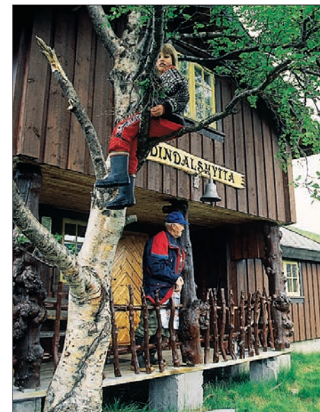
Dindalshytta er en trivelig selvbetjeningshytte og et godt utgangspunkt for turer på Dovrefjell.

I TTs årbok for 2000 / 2001, som også er utgitt som boka "TUR-GLEDE – 104 turer i Midt-Norge", er det beskrevet forslag til turer i dette området.