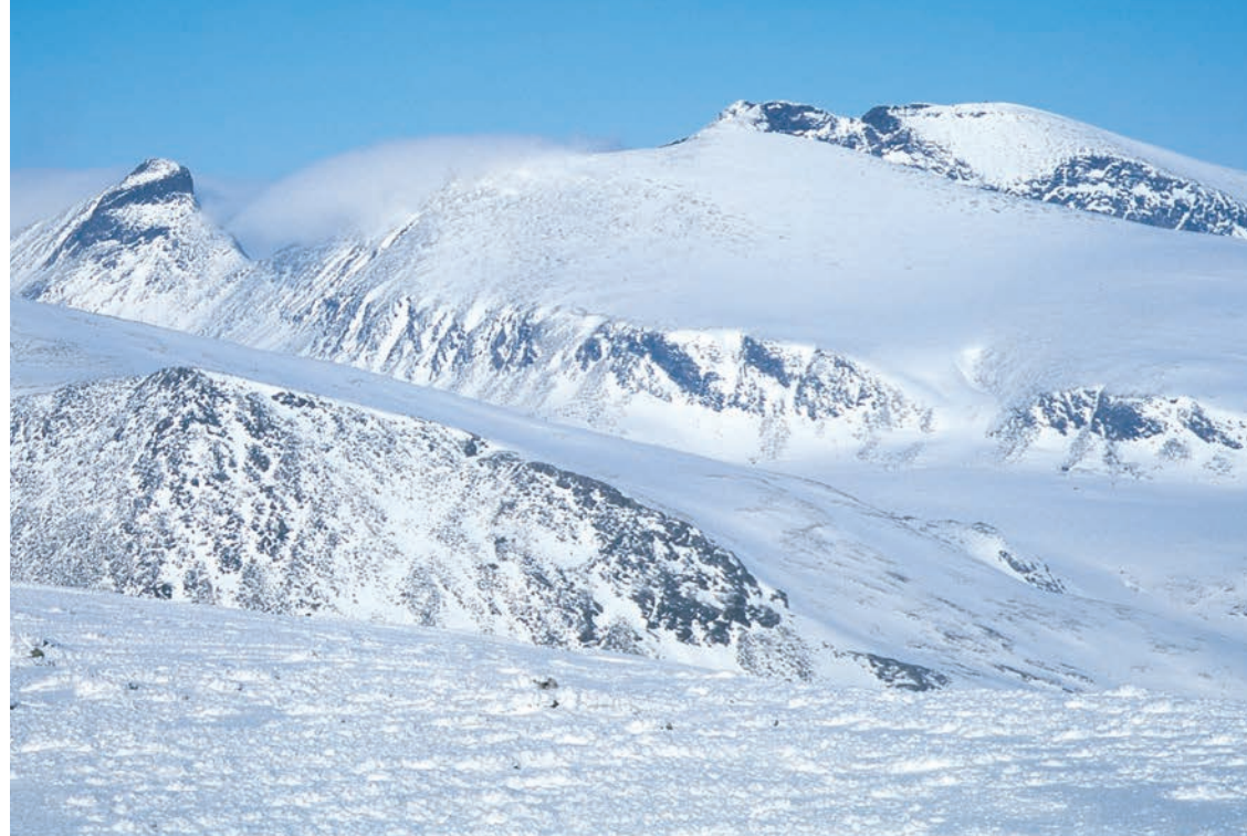
Larstind og Snøhetta fra Skredahøi.

Det store fjellområdet Dovrefjell – Sunndalsfjella vest for E6 er i stor grad Kristiansund og Nordmøre Turistforenings arbeidsområde. TT har en mindre del av området med Dindalshytta og et ansvar for rutene mot Gammelsetra og Åmotdalshytta og over til Engan og Driva. Områdene øst for E6, Orkelsjøområdet, er TTs område.