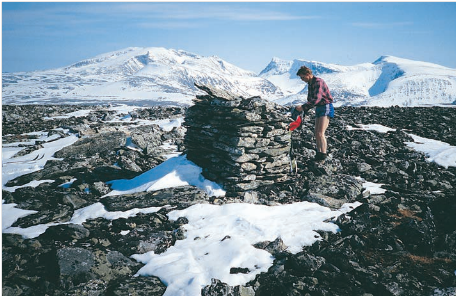
Fra Grytkollen med Snøhetta og Svånåtindmassivet i bakgrunnen.

Det er store og innholdsrike fjellområder som ble vedtatt vernet i regjeringen 3. mai 2002. Områdene som er vernet er i øst fjellområdene mellom Oppdal / Hjerkin (E6), Kvikne og Folldalen. I vest dekker verneområdene fjellet mellom Lesja / Romsdalen og Sunndalen fra Drivdalen, Hjerkin og Fokstua i øst mot Åndalsnes og Eresfjord i vest. Noen delområder med inngrep og virksomheter er ikke med i verneområdene. Vernet dekker fjellturområdene som gjerne er kalt Orkelsjøområdet, Dovrefjell, Skrymtheimen, Sunndalsfjella og deler av Romsdalsfjella.