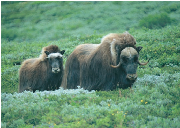
Urtidsdyret moskus overlevde på Grønland og i Canada. Bestanden på Dovrefjell er satt ut fra Grønland.