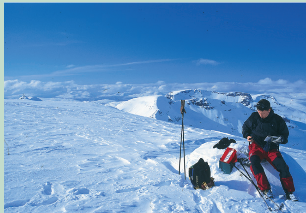
På toppen av Rognnebbha med Pekhøtta og Blånebbha i bakgrunnen.