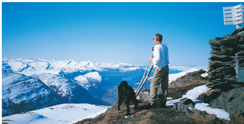
Fra Honnstadknyken med utsikt innover i Trollheimen.

Til Oppdal kommer du både med bil, buss og tog. Ta opp mot Hovden eller Vangslia. Dersom skiheis eller gondolbane går, kan du ta den. Den 15 km lange turen går i et flott høgfjellsterreng over Blåøret og ned til hytta Viongen, ubetjent, TT, privat. Viongen er en del av et sjarmerende hyttetun med i alt 9