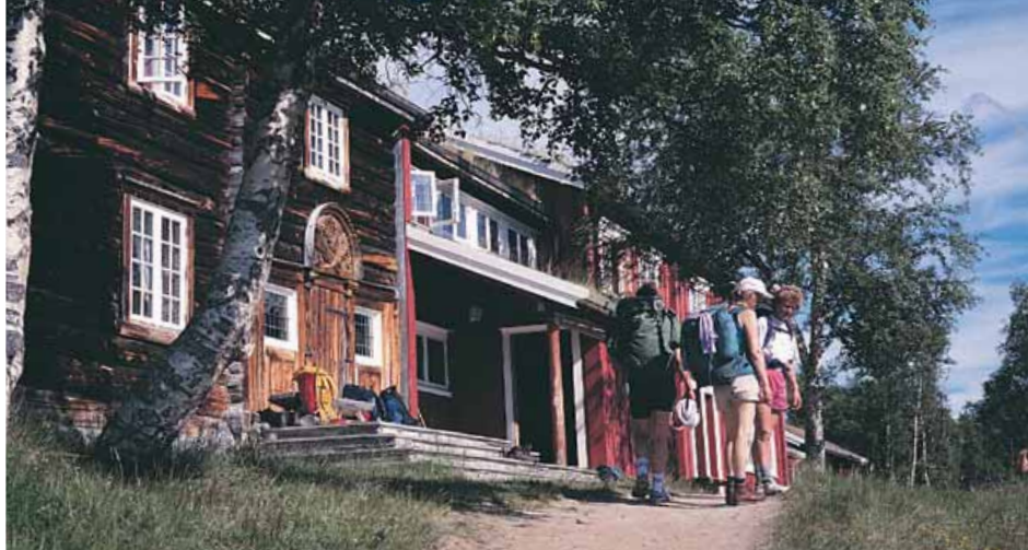
Gjevilvasshytta, 710 moh. Betjent vinterferie, påske og sommer: 62 senger. Ubetjent: 10 senger hele året utenom betjent sesong.