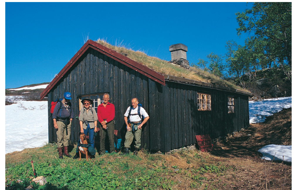
Jakthytte i Lakadalsbu.

På dagsetappe nummer to til Skjækerdalshytta , selvbetjent, NTT, har vi to varianter å velge mellom. Hovedruta på sørsida av Skjækerfjella på 7 t og et alternativ som er to timer lengre gjennom Skjækerfjella. Den lange turen går gjennom glupen mellom Styggatten (Kvitrvævvola) og Tilhengarn, ned til Vakkerdalen og Skjækervatnet. Videre