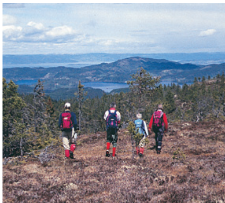
Mot byen fra Gullsiberget.

Det er slett ikke uvanlig å treffe på reinsdyr i området rundt Kjølhytta.