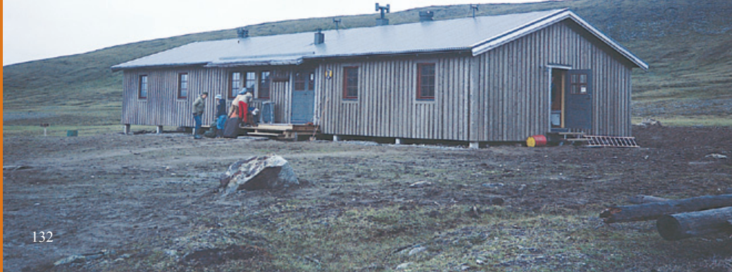
Helagsstugorna ble helt fornyet tidlig på 1980-tallet. Her er en av de nye hyttene.