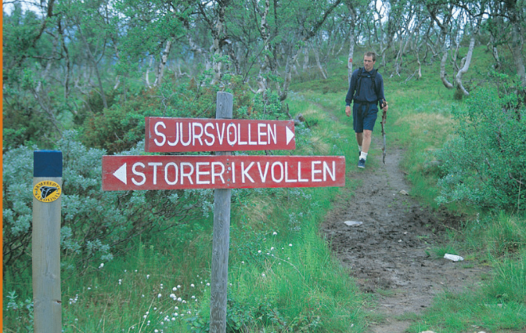
På vei mot Storerikvollen.