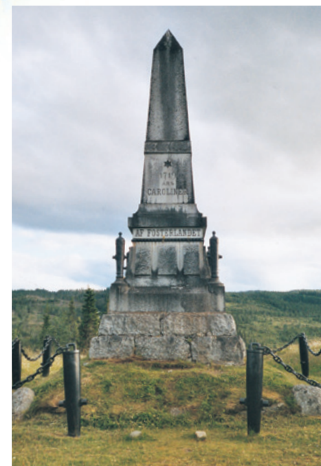
Karolinermonumentet ved Duved. Et lignende monument finnes ved Handöl.

Turens fjerde og siste dag går i lett terreng til Storulvån Fjellstasjon, betjent, STF. Her kan du kjøpe mat før transport til Handöl. I Handöl er det naturlig å starte oppholdet i Hanris hus for å se på Armfeldtutstillingen. Videre bør du besøke Handølsforsen,