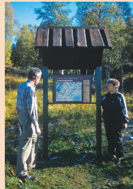
Informasjonstavle om Karolinerleden ved Nordpå.

tre enslige gårdene i Handöl. Omkring 3000 soldater omkom på denne umenneskelige fjellmarsjen. Ytterligere 1400 døde i løpet av vinteren og våren av de skader de hadde pådratt seg. Rundt 600 levde resten av livet som krøplinger. Få begivenheter har levd så lenge på folkemunne som tragedien rundt tilbaketog til general Armfeldt og hans karolinere.