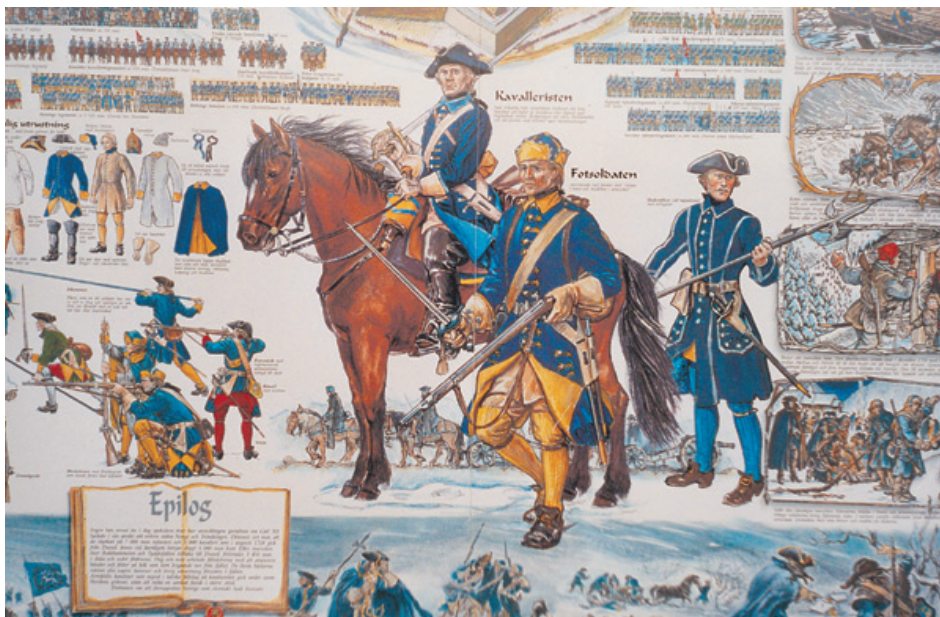
Bildet er fra informasjonstavlen som står ved Duved. Tilsvarende tavle finnes også ved Handöl.

Neste dag går ferden over Bukkhammeren og