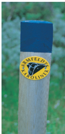
Karolinerleden er merket med skiltstokker.

Ta ettermiddagstoget til Haltdalen st. Det anbefales et besøk på Gammalgården, - den