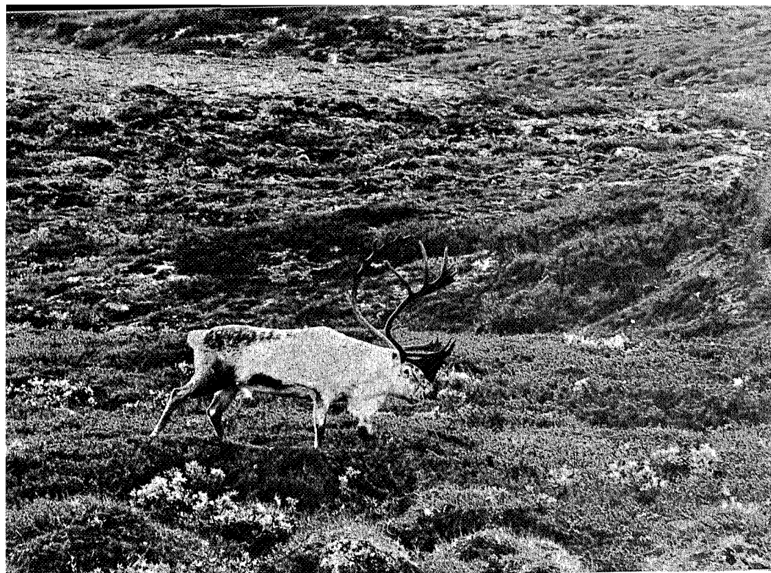
Villreinen krever store sammenhengende fjellområder med vann, elver, breer, sommer- og vinterbeiter, og ikke minst fjellets naturlige ro. Klarer vi å bevare slike fjellområder?

Villreinstammenes såreste punkt er trekkveiene, som livsnerver går de gjennom reinens tilholdsområder, mellom beitelokaliteter, kalvingsplasser, breområder, og bruken er nøye tilpasset årstid, vind- og værforhold. Gjennom våre forfedres dyregraver og funn av piler m.v. kan vi i dag konstatere at villreinen bruker nøyaktig de samme trekkveier som i tidligere tider, de kan anes helt tilbake til steinalderen. En vei, telefon- eller kraftlinje som krysser en av reinens trekkveier, er ofte en tilstrekkelig hindring. Reintrekket opphører og områder som tidligere var forsynt med rein gjennom trekket, blir liggende tomt. Fatale situasjoner kan oppstå hvis trekkveiene mellom f.eks. sommer- og vinterbeiter blir avskåret. Det underlige, og farlige er, at et naturinngrep, enten det er vei, en feilplassert hytte, høyspenttrasé e.l. ikke synes å ha noen umiddelbar virkning.