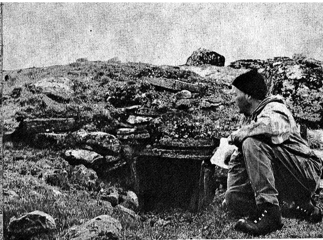
Våre forfedre var beskjedne i sine krav til oppholdssteder i fjellet. Her er inngangen til en steinbu som går fullstendig i ett med terrenget og som villreinen kunne gå over taket på uten å reagere. I dag finner vi ofte slike buer erstattet med komfortable og moderne hytter som reinen skyr på flere kilometer.

Villreinen passerer «nyskapingen», om enn noe nølende, men passeringene blir skjeldnere, for etterhvert å opphøre. Fjellområder