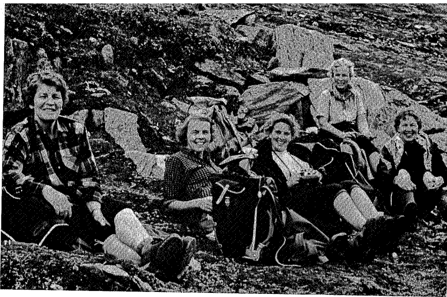
Rast under Blåhø.

for det terrenget vi går i her. Hun hadde visst fryktelig vondt da vi gikk ned de siste bratte kneikene, men ikke et beklagelses ord kom over hennes leber, no sir! Nu har hun også massert på de andres føtter, legger, knær m.v. og er blitt massert selv.