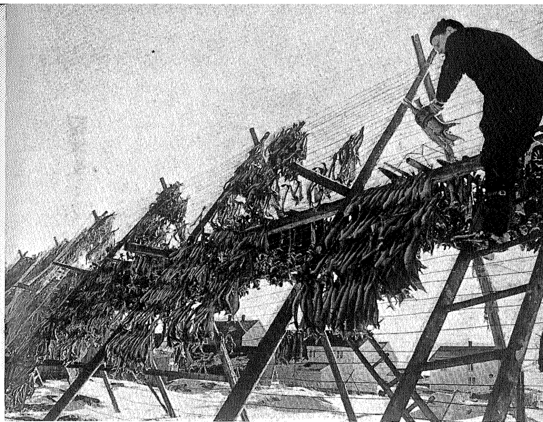
Fisken tørker på hjell.

Titran er kjent for den store ulykken natt mellom 13. og 14. oktober 1899. 25 fartøyer som var ute på feltet, forsvant og 140