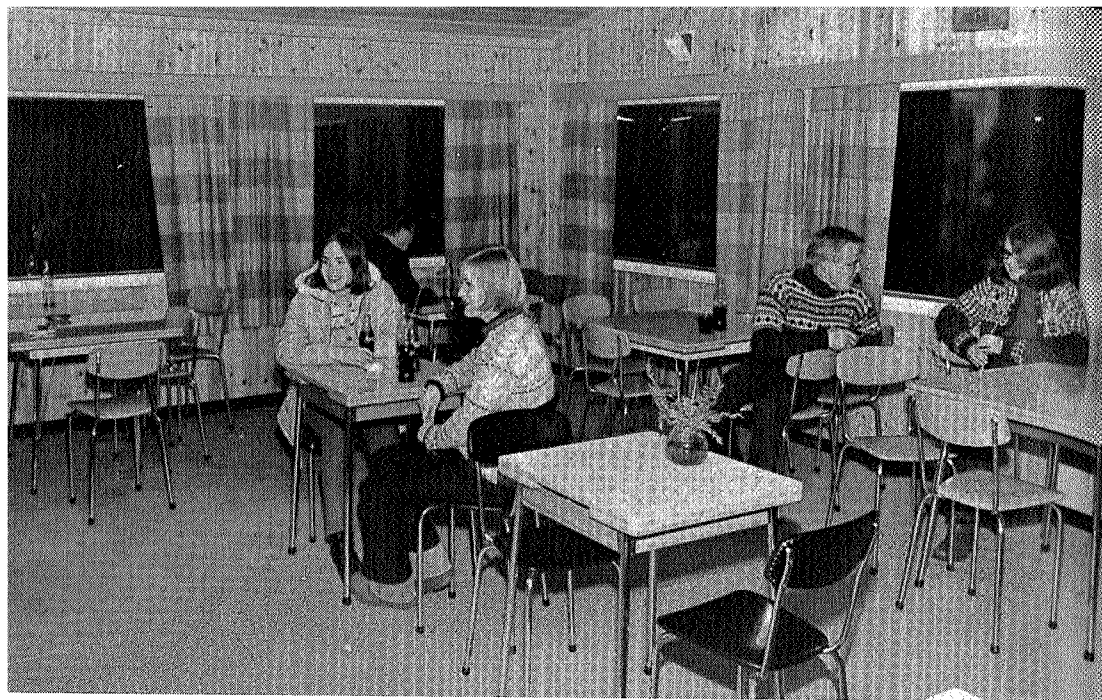
Ungdomstreff på Kaféen.