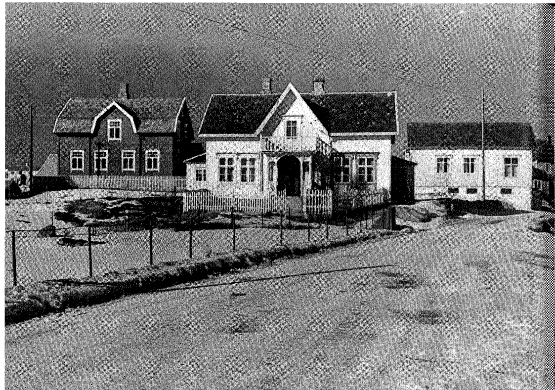
Titran centrum. Kaféen til venstre.