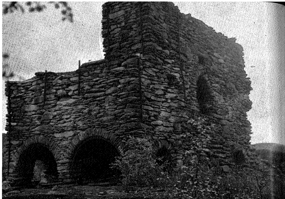
Smeltehytta i Alen