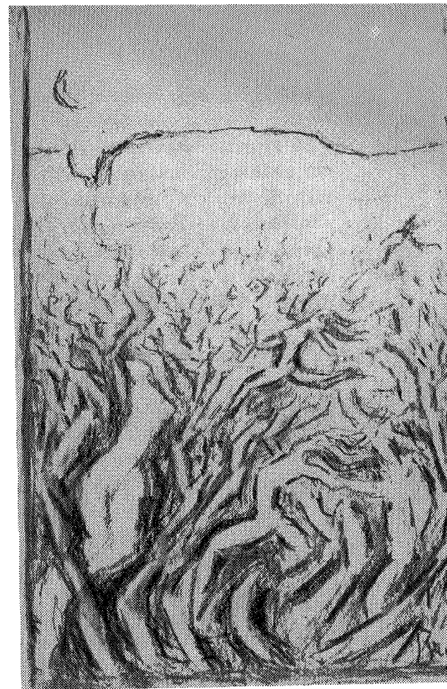
Baletten i Né. Tegn. av Ragnar Løchen.

Men hva med omformingen av Vestlandets lyse løvskoglier til