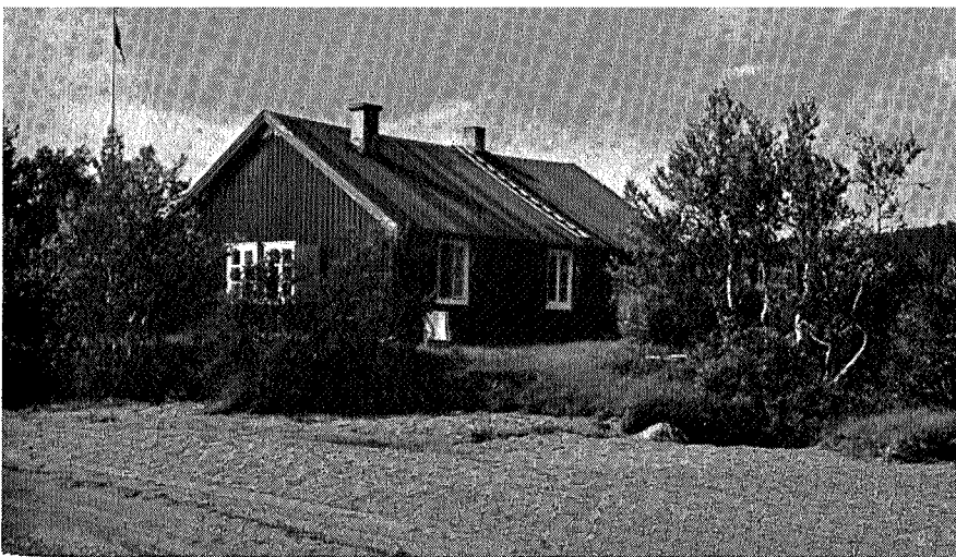
Den reviderte jaktstuen, 50 år etterpå.