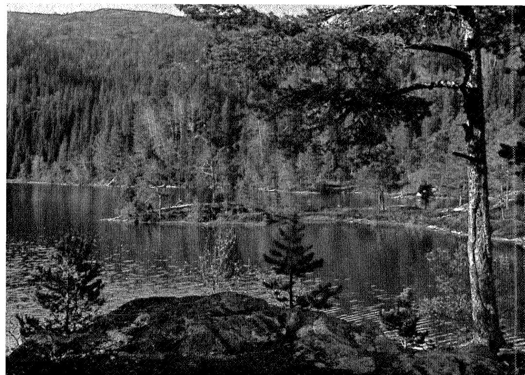
Ved Kopperdammen (Bymarka)