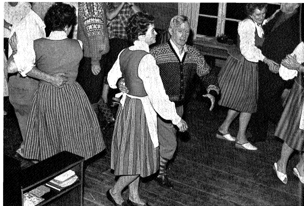
Dansen går i peisestua