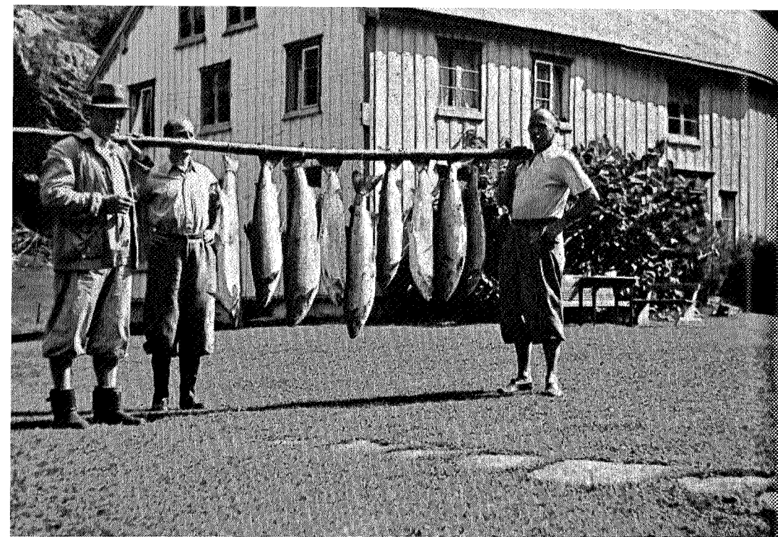
1 dags laksefangst på Storfale