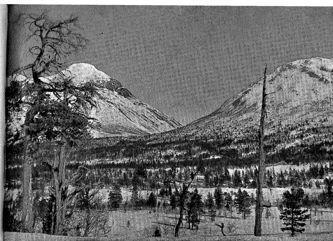
Mot Svartådalen, Trollhetta, Geithetta

Vi fant snart ut at om vi hele tiden gikk i retning mot Rigel,