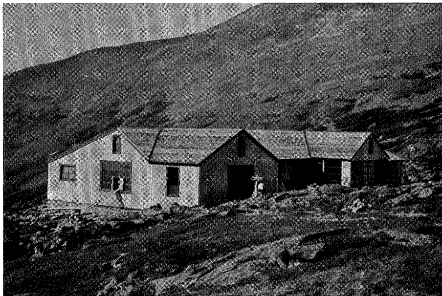
«Lakes of the Clouds»-hytta