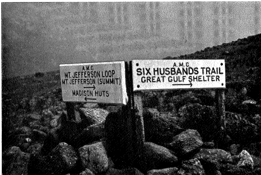
Alle stier har navn