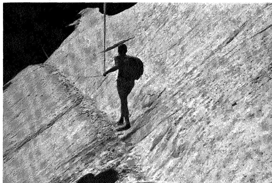
Over en farlig snøbre

En foturist føler seg rimeligvis ikke helt vel til rette når han