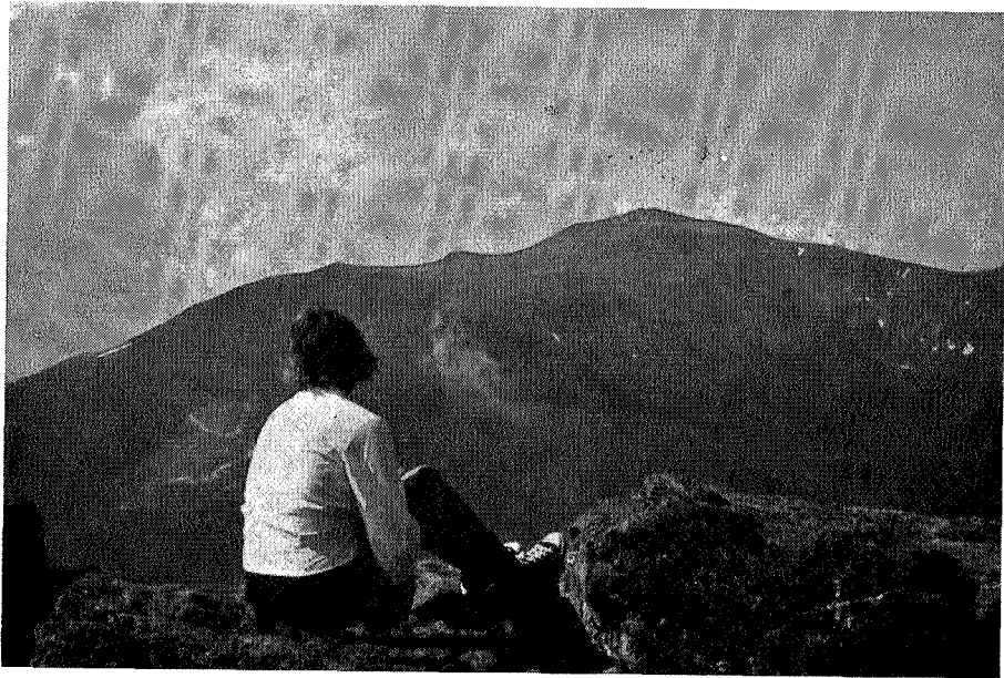
Mot Mount Washington