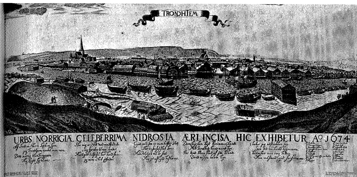
Maschius's kobberstikk av Trondhjem

Bryggene ble uten unntakelse gjenoppført med gavlen mot elven. Det ble forbudt å lagre særlig lett antenkelige varer i bryggene, slike varer måtte lagres på Baklandet, som ennå for størstedelen var ubebygget.