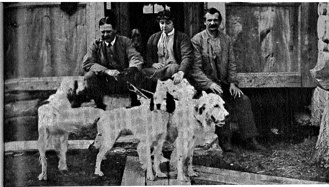
Foran hovedinngangen på Singerhytta