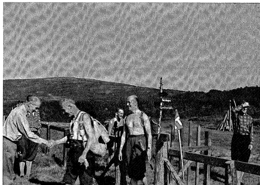
Gjestene ankommer til innvielsen