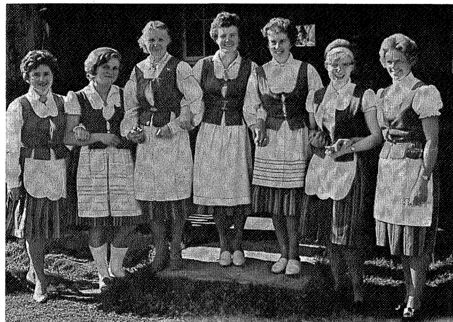
Betjeningen — et vakkert syvkløver