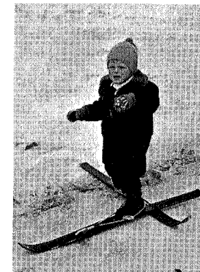
Problemene melder seg i ung alder!

Vi vil også nevne at Turkomitéen økonomisk har støttet hovedforeningen, blant annet ved innkjøp av blinkfyr til de fleste av foreningens hytter, fyr som har kommet godt med i fjellsikringens tjeneste i Trøndelag. Fremviserapparat er også blitt skjenket TT av komitéen.