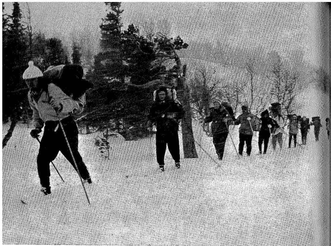
Skandinaver på Karolinertokt i Sylene