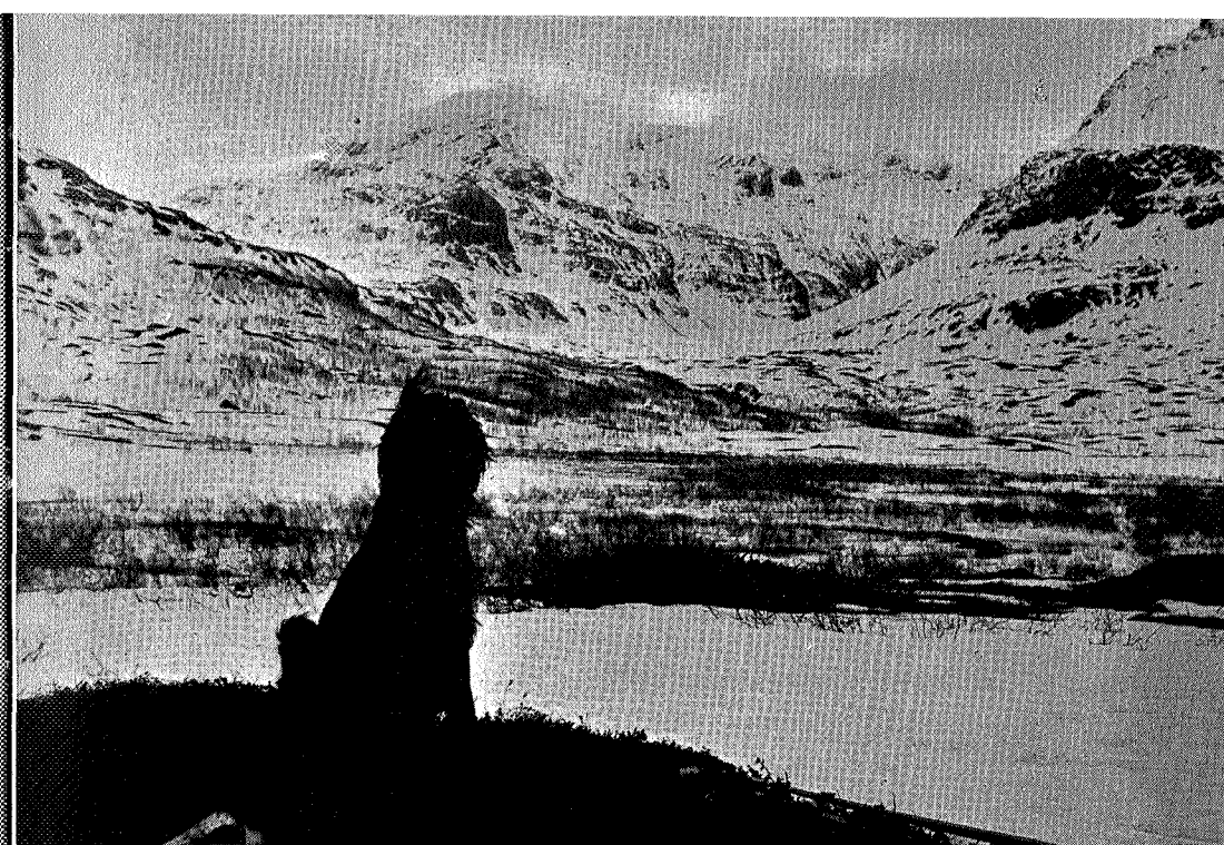
Flat og flå går dalen sørover

Stjerneblank løftet himmelen seg. Snøen spekte, med søkk og