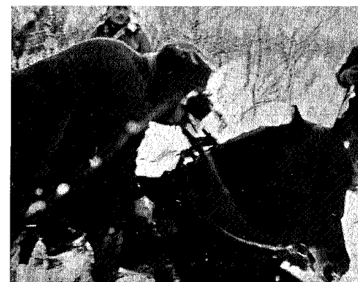
Det var ikke hver natt at føret holdt

Johan Falkberget, som har levet sitt liv ved fjellet, skriver at da Brodde nærmet seg Kjølen med kaldere netter, blå skar og sluk, der skyggene ble kaldere og svartere etter hvert som han gikk inn