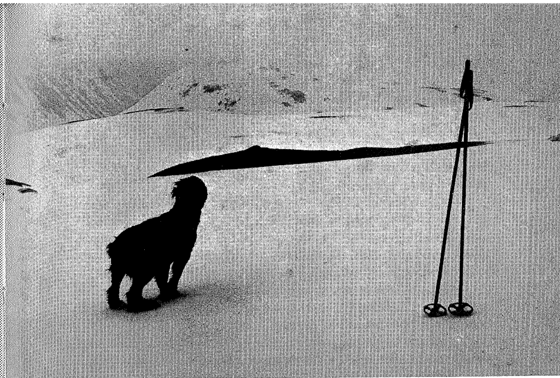
Der borte — hvor fjellet svartner — lå skyttergravene

På andre siden av dalen lå Store Ballak, en av de mest dominerende stillinger vår fiende hadde. Angrepene ble slått tilbake gang på gang, og var nesten oppgitt da den trønderske bombekaster ble