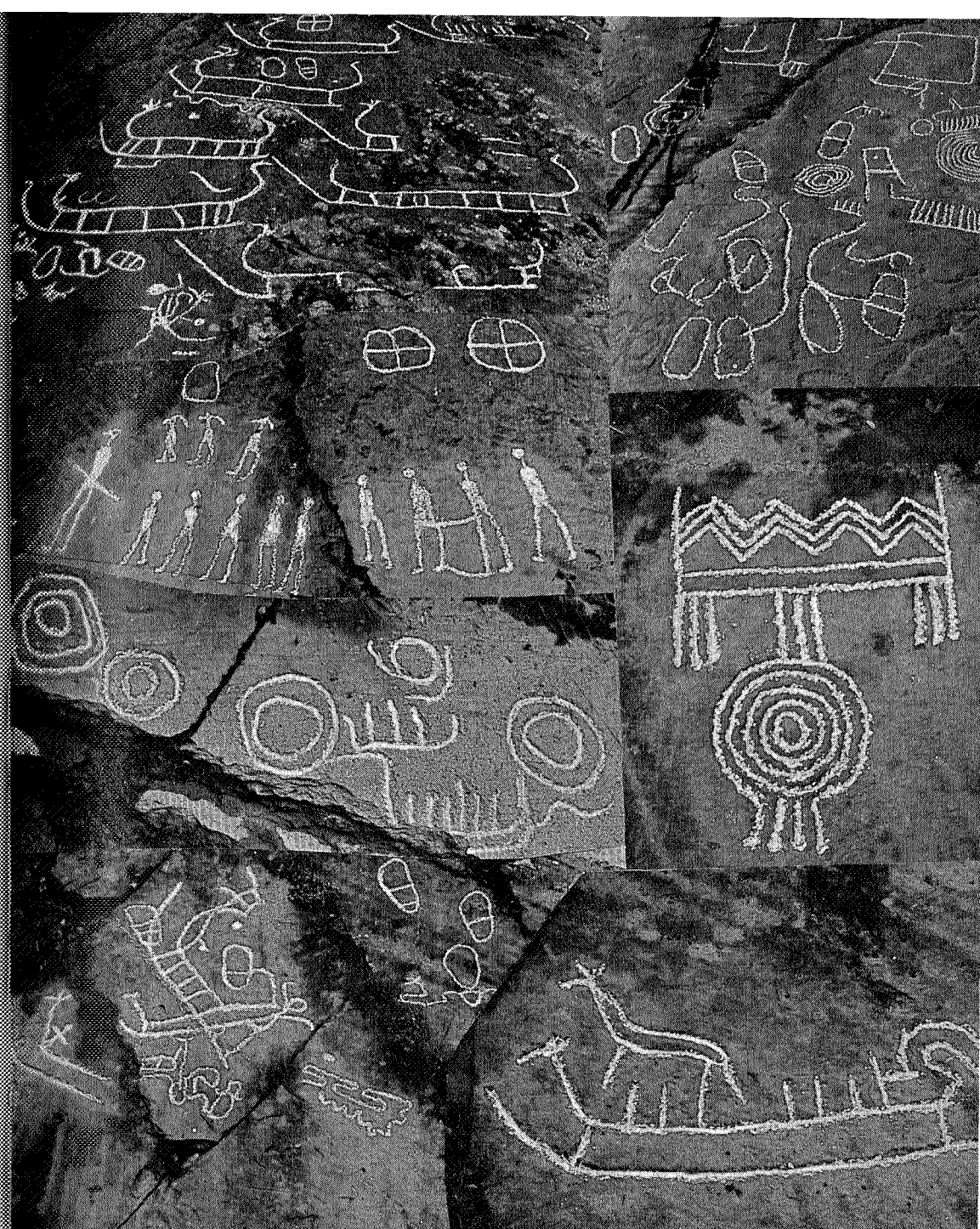
Fra billedvrømmelen på Leirfall-feltet

Hele den idéverden som vi møter i disse helleristningene gir oss assosiasjoner til den indre del av Middelhavet. De samme tegn og symboler finner vi i den gamle kulturen på Kreta. Skipsfigurene viser tydelige likhetstegn med gammel-greske og egyptiske skip. Skip og solbilleder blir kombinert på samme måte som i Egypt, ja, vi kan til og med finne framstillinger av vogner av akkurat samme type som den stridsvognen som fantes i Tutankamons grav!