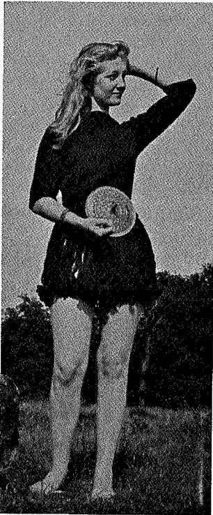
Bronsealderens storbondedatter var et barn av solvarme sommere. I danske graver finner vi henne med en tett-sittende jumper og et hulahula-skjørt av ullsnorer, bar-bent — men med manikurerte negler og praktfulle bronse-smykker.

solgudene Ra, Horus og Osiris ofte er framstillet med fuglehode, og har solskipet som attributt.