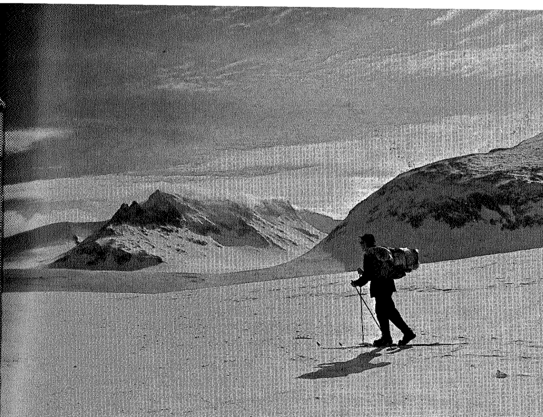
Ut på tur i Sylarna