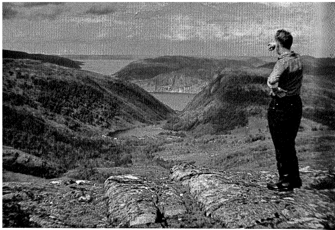
Utsyn mot Vollaseter, fjorden og leia