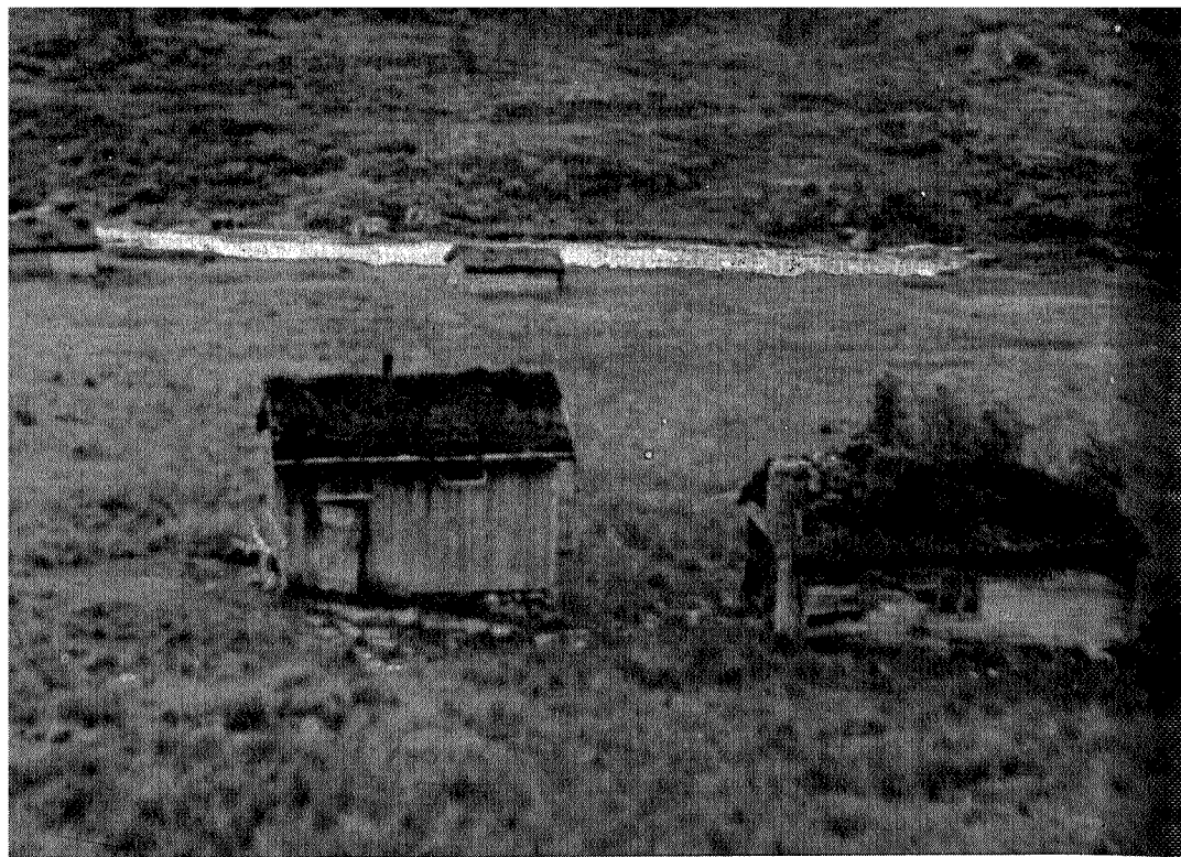
Kleivgarden, boplassen til Gammelkleivinn, slik den ser ut i dag

på Kleivgarden i Hammarkleiva. Han hette Ola, men blir oftest kalla Gammelkleivinn. Denne Ola'n skal ha vore en overlag stor og førlemma kar, og at kreftene i fullt monn svara til kroppen, kan vi høre av historiene.