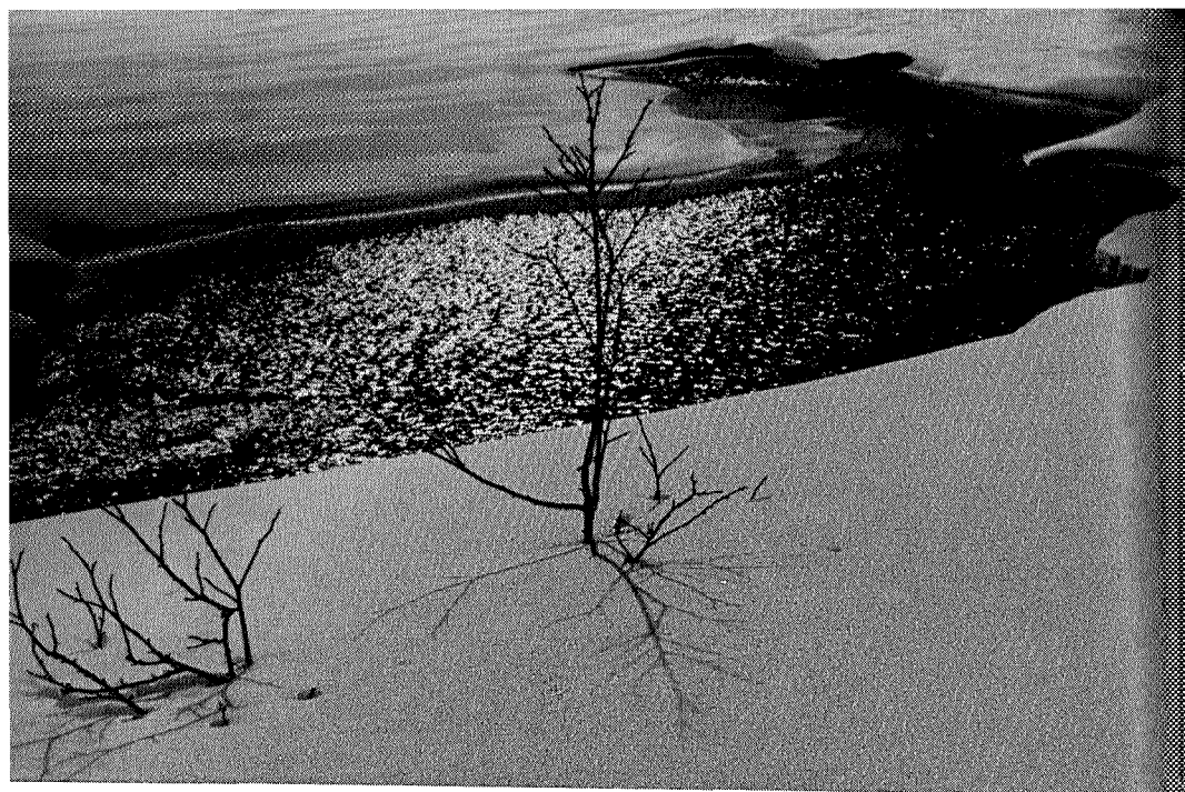
Hederlig omtale: «Åpent vann» Kåre Halse

& the hay being dried & it all looked very beautiful in the evening sun.