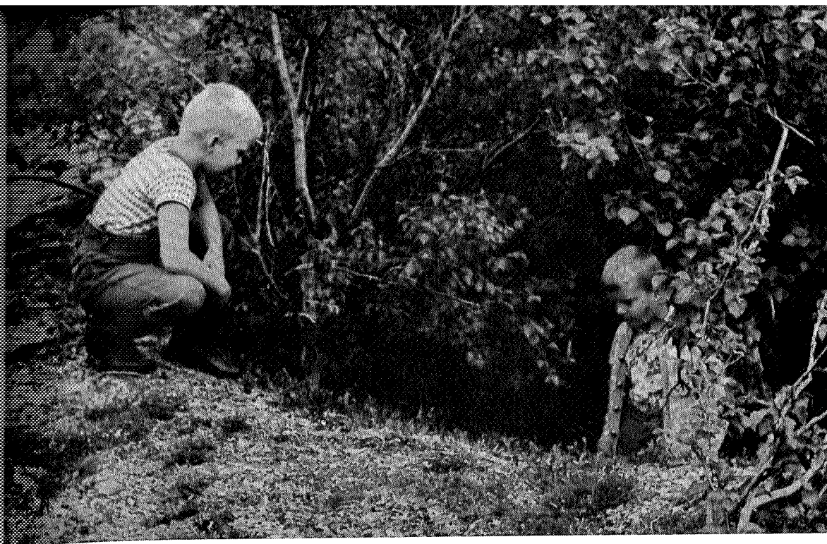
Guttene ved dyregrav i Jøldalen

Vår oppdagelsesreise fortsatte siste sommer da guttene anskuelig og levende fikk et lite innblikk i en periode av vår historie som vi vet lite om. Det begynte allerede like ved Jøldalshytta. Vi var på vandring vestover og var ikke kommet lengre enn like forbi den første Grindalssetra, så lå det en dyregrav der ute på kanten av helningen mot nord. Kloss i veien fant vi den med et mørkt hull i det ellers så slette terrenget. Så overvettes dyp er den ikke lenger, og lite faretruende ser den ut med alle de busker og trær som fyller den i dag.