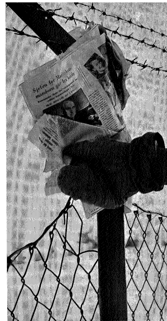
Et slikt trist syn kan en møte i fjellet der militæret har overtatt området

Apropos levestandard , ligger det ikke litt mere i dette begrep enn kjøleskap, biler og televisjon? Må vi bo ett år i New York for å bli klar over den umåtelige verdi naturen har for nordmenns levestandard? Hvis den fortsatte industrialisering her i landet er betinget av slike overveldende inngrep i naturen, er det da ikke grunn til å tenke både vel og lenge over hva det i realiteten koster oss? Setter vi saken på spissen, kan vi si det slik: Vi er ikke i dag så fattige at vi er nødt til å samle hver eneste vassdråpe i Norges land i rør og tunneler for å gjøre dem om i kroner og ører — i inn- eller utland!