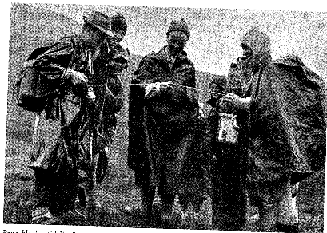
Brua ble høytidelig åpnet