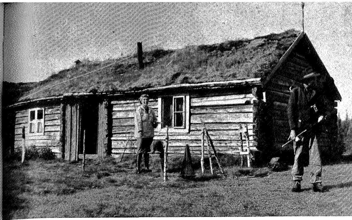
Grønningsetra i Snåsafjella er et godt sted for en fjellvandrer

Vi «trampet» videre innover Imsdalsveien. En drosje suste forbi oss, mens forskremte sauer sprang til hver side av veien. Merkelig å tenke på — for seks år siden, da vi første gangen dro forbi, gikk vi etter en behagelig, opptråkket sti. Bulldozeren og den moderne teknikk har trengt seg fram og forandret de idylliske seterstiene til moderne vei. Ved Finnkjerringfjellet finner en forklaringen på dette veianlegget. Her inne lages nå de flotteste skiferheller som tenkes kan. Men enda finnes det uberørt natur i de mektige Snåsafjella. Det betyr bare at du må stadig lengere innover viddene — de ukjente