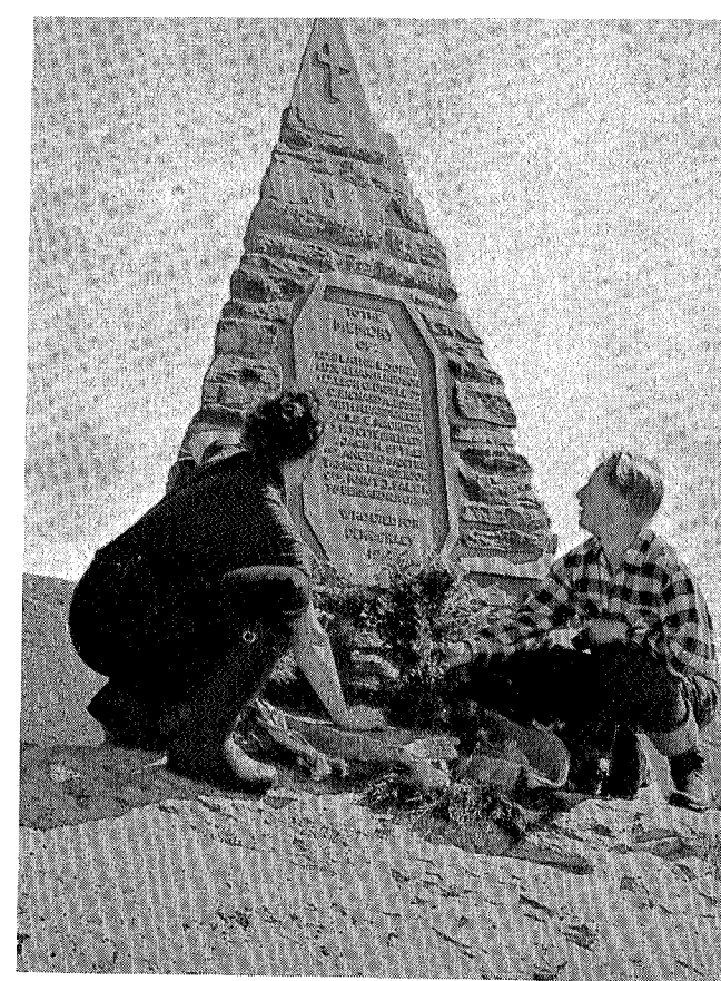
Minnestøtten i Plukketjernfjell

Har du ferie og kan benytte den i fjellet, da bys det mange muligheter på disse kanter. Fram til grensegården Holden er det ikke så langt, særlig hvis du får tak i båt og kan ro helt innerst i Grønningen. Da er det bare en times marsj forbi Skjellbredvatnet, og da står du overfor valget: Enten med motorbåt over Holderen og videre inn i Sverige, eller turen om Gaundalen fram til Ogndalen eller Verdal. Min ønskedrøm er å få stifte nærmere bekjentskap med disse fjellpartiene, men også området mot Lierne er verdt å ta med blant de førsteprioriterte turene i Nord-Trøndelags fjell. Derfor er det å ønske at enhver tilhenger av fiske og friluftsliv, spesielt ungdommen, må få oppleve gleden og skjønnheten ute i naturen — få del i de rike muligheter i Snåsafjella.