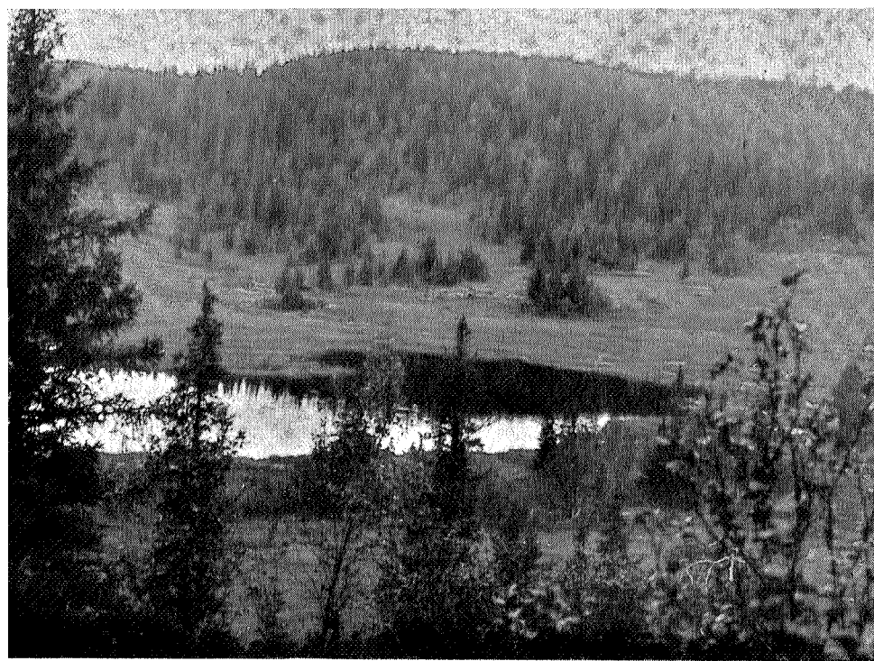
Herretjärn, Østby Tydal

lades sakta benrester. Sex kraftiga skallar och ben av högresta män låg tätt samman. Medan vi undersökte dessa fynd började det skymma och vi ansåg, att vi knappast kunde få veta mer än vi redan funnit utan att frilägga hela det stora gravområdet. Allt tydde på att vi stod vid en krigargrav, om vilken traditionen talat sanning. Någon träffning på denna plats är ej heller känd. Däremot talar den armfeldtska krigshistorien från 1718—1719 om stark avgång från förbanden genom sjukdom. Ett antal sjukkvarter skulle även ha varit ordnade från Stene Skans upp emot Suul. Kanske de okända krigarna i graven vid Lillmon ha dött i frossa på återväg till Sverige under uppehåll i Lillmogården? Undersökning av vissa rester, som sändas till Oslo fastslog, att gravresterna voro från 1700-talets början, och därmed torde man ha kommit så nära lösningen som möjligt.