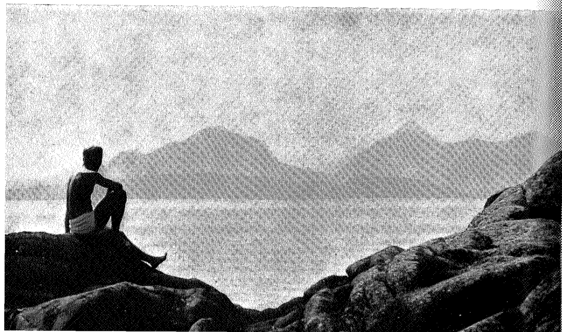
6. premie. «Utsikt fra Sør-Hitra» Egil Rein, Trondheim