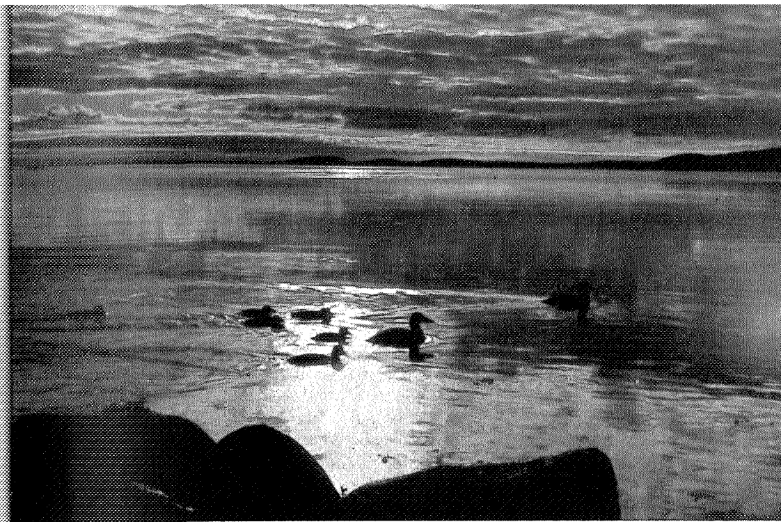
2. premie. « Aftenstemning » E. Wiese-Haugland, Strinda