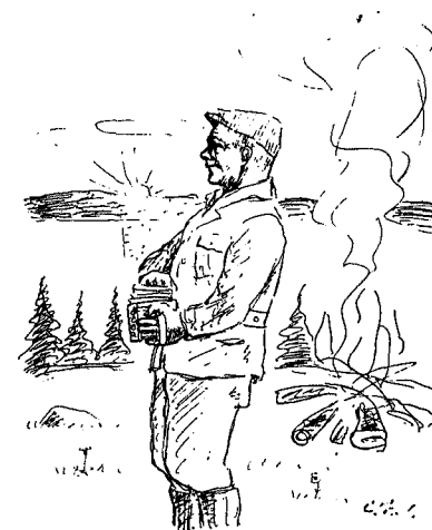
TT-turenes «faste musikk».