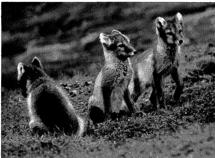
Hvitrevhvalper i Sylene.