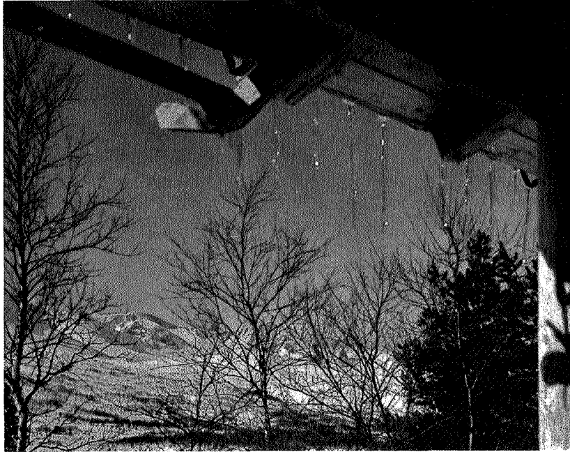
Vårvær i Storlidalen.