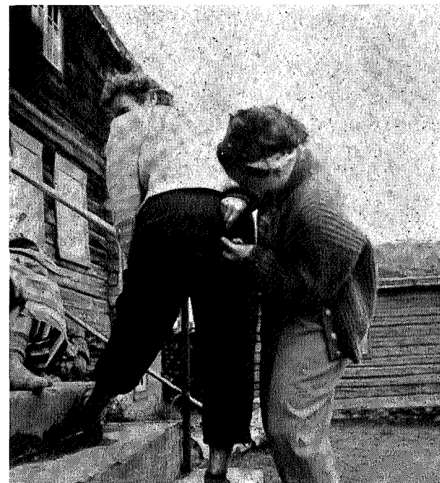
Sylene var kvasse. Buksa broderes.

Det som du opplever i møte med barndomslandet — det er ditt og ingen annans. Du opplever det like sterkt kvar gong du må gje etter for lengten etter li og fjell og vidder, og du leitar deg tilbake til landet der eventyret lever — til landet utan sorger.