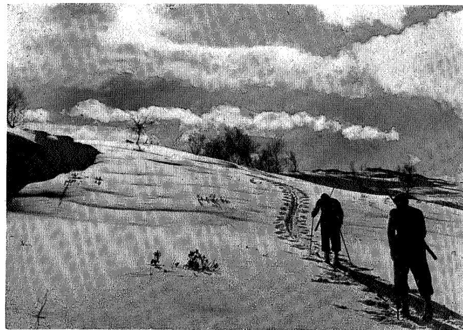
Månen viser vei.