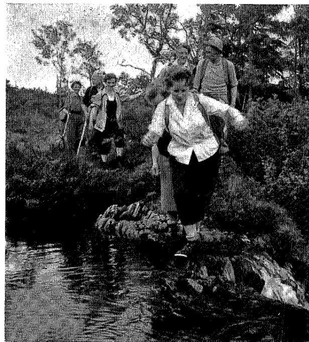
Safari i Torsbjørkdalen.