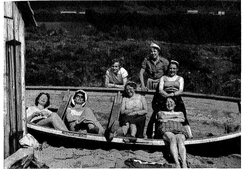
En båtlast lakris

Neste dag skulle turen gå til Kårvatn. Alle håpet at solen ikke skulle bli så sterk denne dagen, men disse bekymringene var overflødig. Torsdag morgen regnet det som om himmelens sluser var åpne. Denne morgenen fikk Trollheimshytta stor avsetning på sin havregrøt. Alle visste at dagens marsj var ganske lang, den lengste