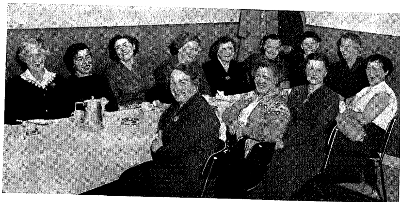
Vertinnebesøk i Trondheim.