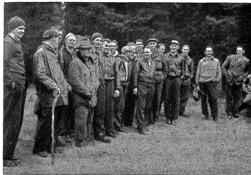
De som slapp igjennom

Det hele er ennå uklart for bevisstheten, men to mann sto på gulvet og holdt i hverandre. En morsk stemme sa: «De er arrestert.» Vi andre lå i krokene hvor det var mørkt. Den ukjente fredsforstyreren hadde øyensynlig ikke sett andre enn den ene midt på gulvet enda. Han hadde det heldigvis svært travelt med å sikre seg førstemann. Stemmen var ikke til å ta feil av — tre mann reagerte samtidig. En satte kursen for døren, mens de to fór ut gjennom hver sitt vindu som oljete lyn. Uheldigvis for han som valgte døren, møtte han en hindring i form av lensmannsbetjenten. Begge to veide sine 80—90 kg og dermed bar det overende med begge to. Det skal