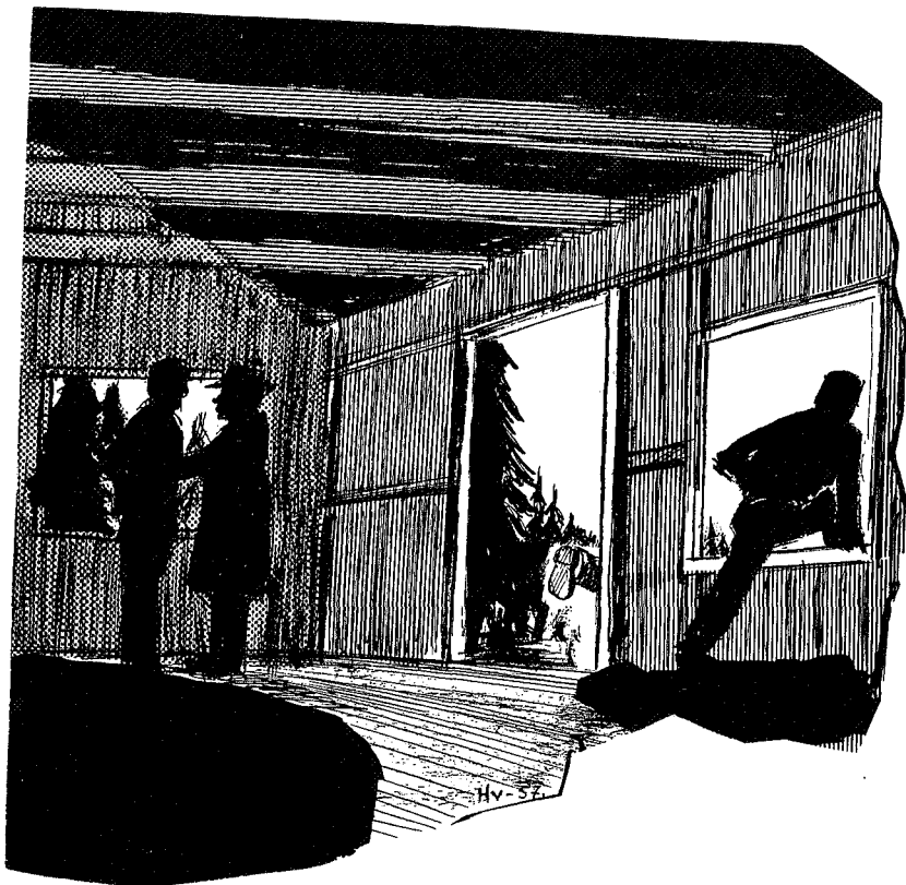
To mann forsvant fort

Det hele er ennå uklart for bevisstheten, men to mann sto på gulvet og holdt i hverandre. En morsk stemme sa: «De er arrestert.» Vi andre lå i krokene hvor det var mørkt. Den ukjente fredsforstyreren hadde øyensynlig ikke sett andre enn den ene midt på gulvet enda. Han hadde det heldigvis svært travelt med å sikre seg førstemann. Stemmen var ikke til å ta feil av — tre mann reagerte samtidig. En satte kursen for døren, mens de to fór ut gjennom hver sitt vindu som oljete lyn. Uheldigvis for han som valgte døren, møtte han en hindring i form av lensmannsbetjenten. Begge to veide sine 80—90 kg og dermed bar det overende med begge to. Det skal