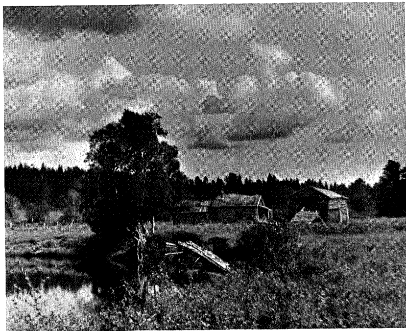
Øyvollen i Singsås

Og jeg har allerede vært der mange ganger siden, i tankene. Minnet er av dem en gjerne vender tilbake til.