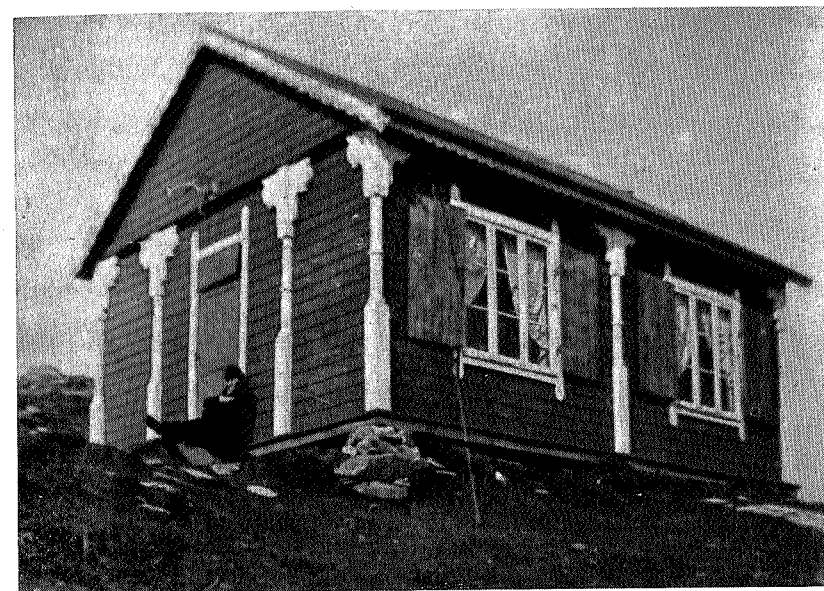
Gråkallhytta 1890. Revet av tyskerne 1942

Våre uberørte høyfjellsstrøk blir etterhvert gjennomskåret av veier på kryss og tvers, og mange steder anlegges det også nye kunstige innsjøer som totalt forandrer strøkets karakter. Spesielt sjenerende blir dette i vassdrag som blir fullregulert, idet de kunstige dammer ikke blir fulle hvert år, men blir liggende med stygge strandkanter hvor ofte halvrotne trær og lignende stikker opp. Vi ser det derfor som en av våre viktigste oppgaver i fremtiden å forhindre og avdempe disse skadevirkninger mest mulig. Disse problemer har nemlig rykket oss tett inn på livet med de planer som det nu arbeides med både i Neavassdraget for Sylenes vedkommende og i Trollheimen.