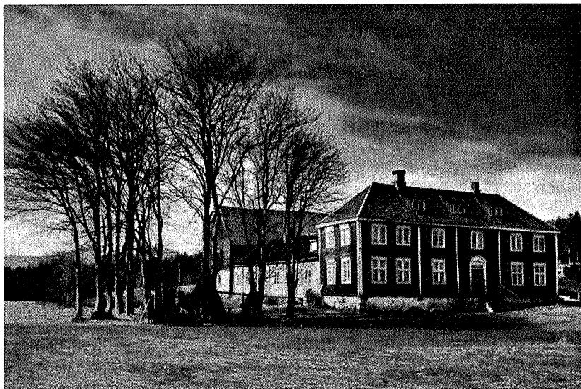
Sommerseier (Kanselliråd Sommers landsted)