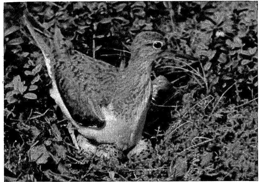
Strandsnipe på egg

Den koseligste av alle fugler, og den som holder seg tetttest til menneskene, linerlen, trippet omkring hytta da vi kom, og da den holdt seg i nærheten av vedstabelen, tenkte jeg at den kanskje hadde redet sitt der. Vedstabler er yndete redeplasser for linerler. Men den viste ingen tegn til opphisselse da jeg nærmet meg vedstabelen, så jeg forstod at redet var ikke der alikevel. Når en kommer sånn til en hytte eller seter, bør en ha øynene med seg etter reder. Fuglene ankommer jo mens husene står tomme, og da