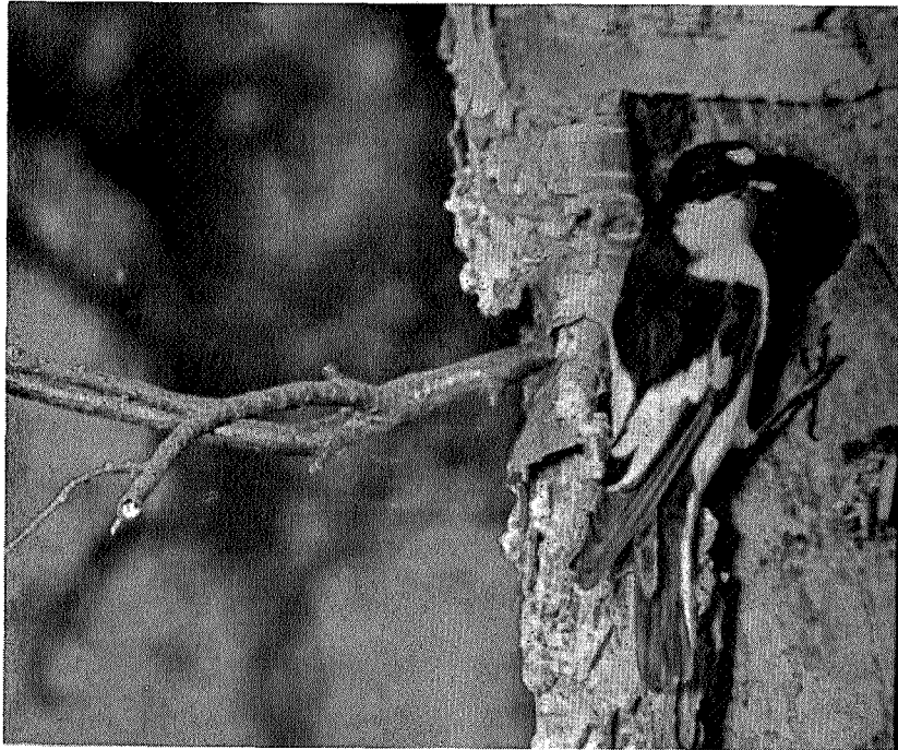
Fluesnapper ved reirhullet