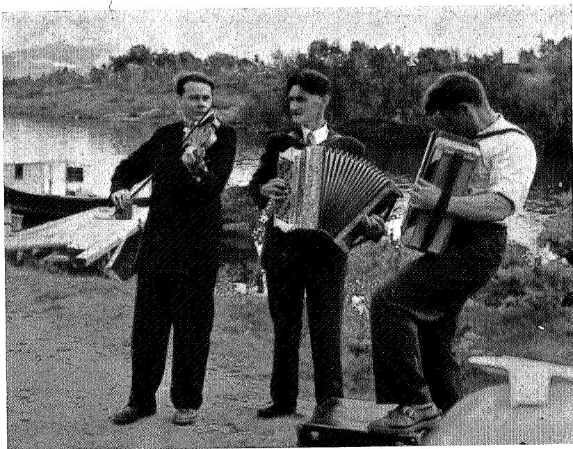
Musikken møtte gjestene i Nøsteråa