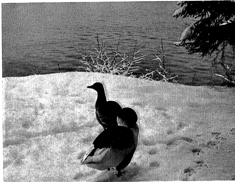
Idyll ved Nidelven