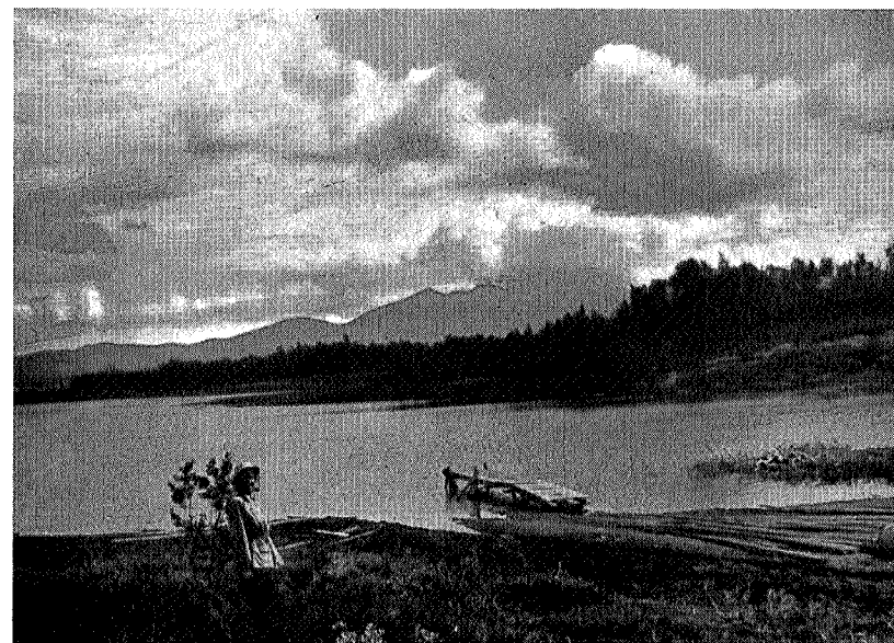
Sylene fra Nøsteråa

Derfor må det være friluftsfolkenes kjære plikt å verne om dette praktfulle villmarksområde. Vi må alle være på vakt mot dem som vil bryte ned og ødelegge denne storslåtte naturen. Jeg vil hermed tillate meg å rette en appell til alle turistforeninger og utøvere av friluftsliv om å gå inn for å få Femundsmarka fredet, om ikke hele, så iallefall Gutulia og Røavassdraget med de nærmeste omgivelser.