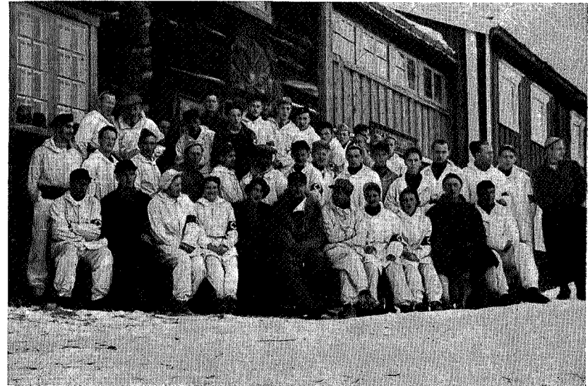
Deltakerne i kurset