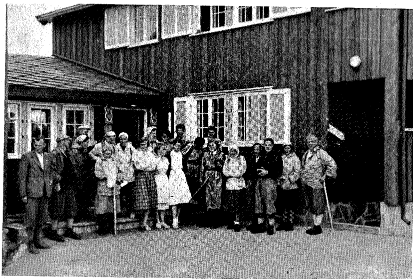
Avskjed fra Reinheim