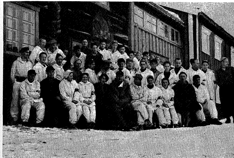
Deltakerne i kurset